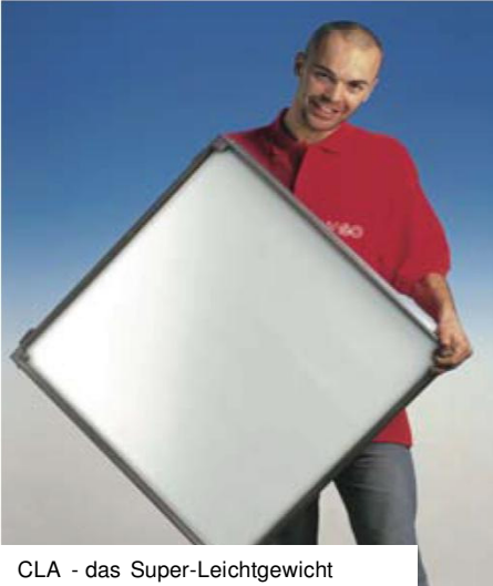
CLA - das Super-Leichtgewicht